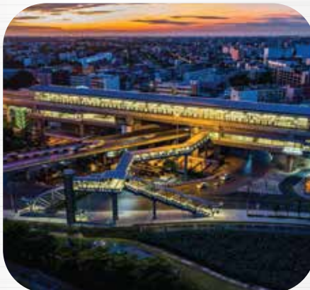
รถไฟฟ้าสายสีเขียว The MRT Green Line (North) Project