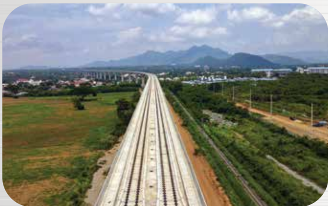
รถไฟทางคู่ ช่วงมาบตาพาด-คลองขนานจิตร Double Track Railway (Mab Ka Bao-Klong Khanan Chit)