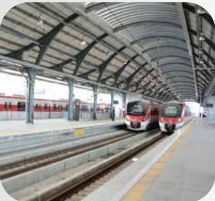
รถไฟฟ้าสายสีแดง SRT Red Line Project