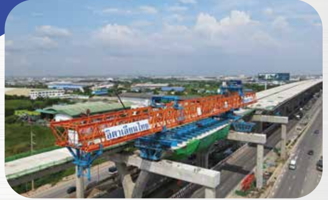
โครงการทางหลวงพิเศษระหว่างเมือง สายบางขุนเทียน บ้านแพ้ว Bang Khun Thian Ban Phaeo Intercity Motorway Project