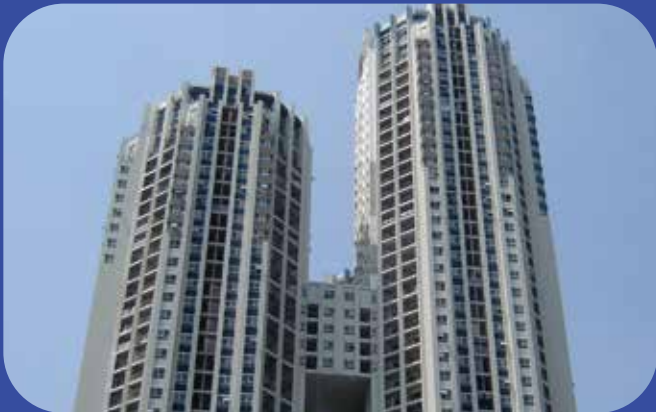
คอนโดอเวนิว Avenue Condominium