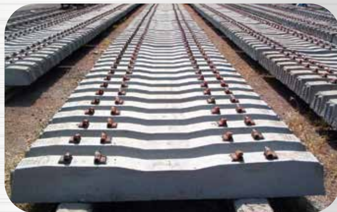
หมอนรถไฟ Concrete Sleeper