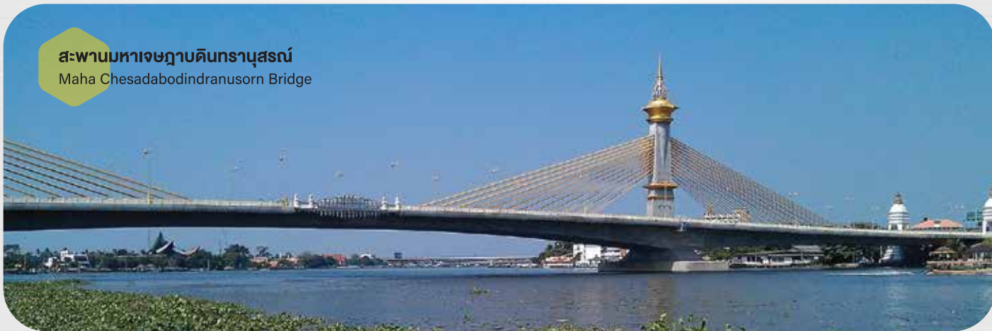
สะพานมหาเจษฎาบดินทรานุสรณ์

Third Thai Lao Friendship Bridge (Nakhon Phanom Khammouane)