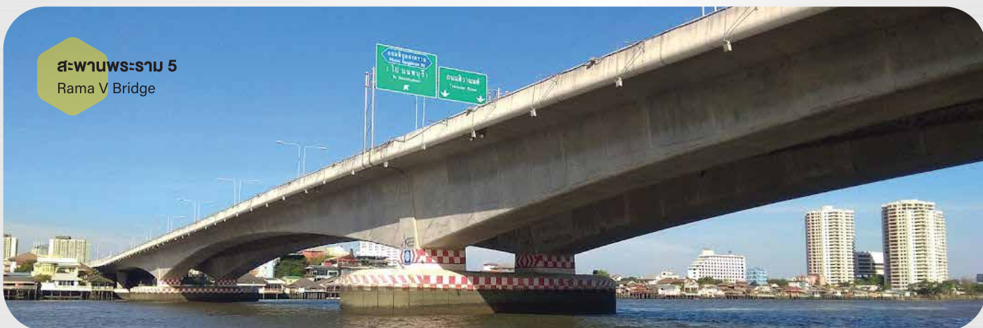
สะพานพระราม 5