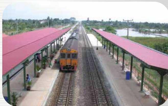
รถไฟทางคู่สายฉะเชิงเทรา-คลอง 19-แก่งคอย Double Track Railway Chachoengsao Kaeng Khoi