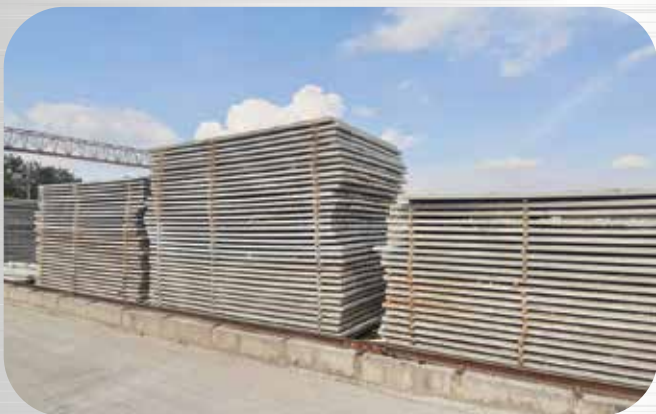
แผ่นพื้นต้นคอนกรีตอัดแรง Concrete Slabs