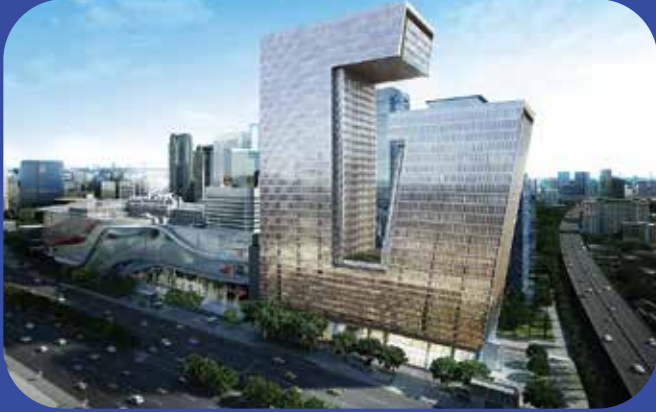
อาคารจี ทาวเวอร์ แกรนด์ พระราม 9 G Tower, The Grand Rama 9