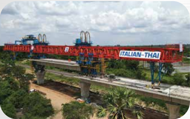
รถไฟความเร็วสูงไทย - จีน (กรุงเทพ-นครราชสีมา) Bangkok Nakhon Ratchasima high speed railway