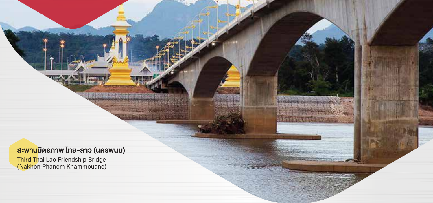
สะพานมิตรภาพ ไทย-ลาว (นครพนม)

Third Thai Lao Friendship Bridge (Nakhon Phanom Khammouane)