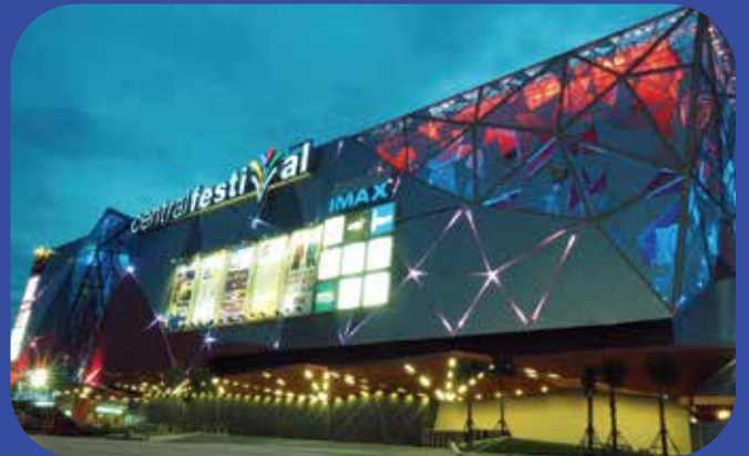
เซ็นทรัลฟาสต์ใหญ่ Central Festival Hadyai