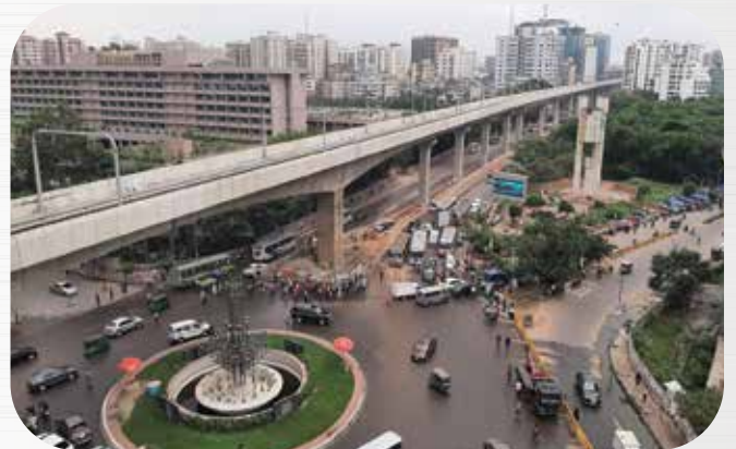
รถไฟฟ้าขนส่งมวลชน กรุงเทพฯ (บางเกล้า) (บังคลาเทศ) Dhaka Mass Rapid Transit Development Project - Bangladesh