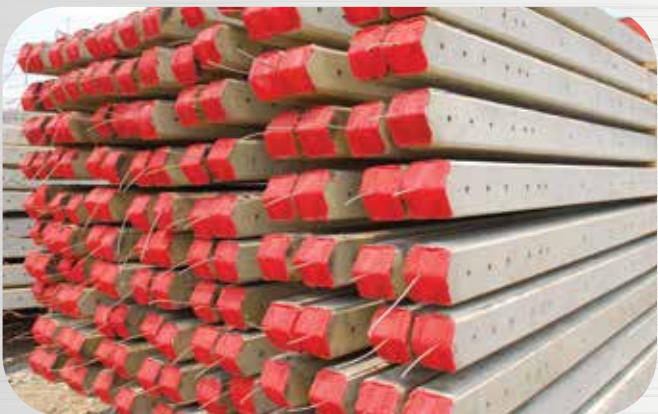
เสาไฟฟ้า Electric Poles