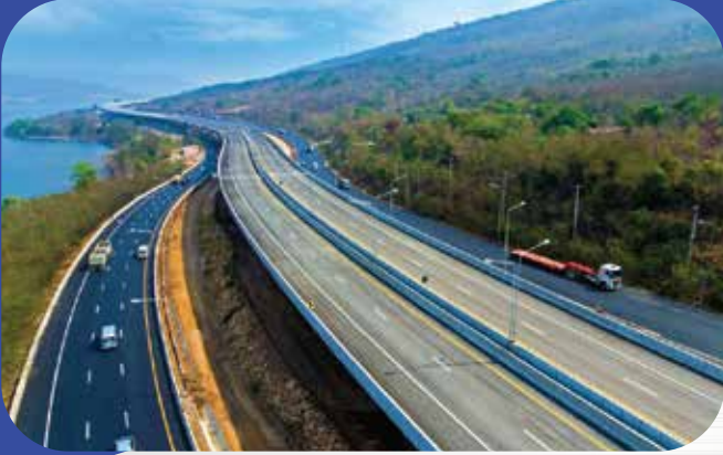
ทางหลวงพิเศษระหว่างเมืองสายบางปะอิน-นครราชสีมา Bang Pa In Nakhon Ratchasima Intercity Motorway