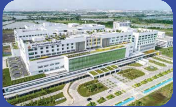
โรงพยาบาลรามธิบดีจักรีนฤเบดินทร์ Ramathibodi Chakri Naruebodindra Hospital