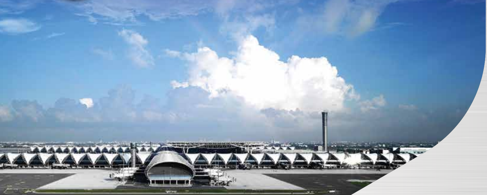
ท่าอากาศยานสุวรรณภูมิ Suvarnabhumi Airport