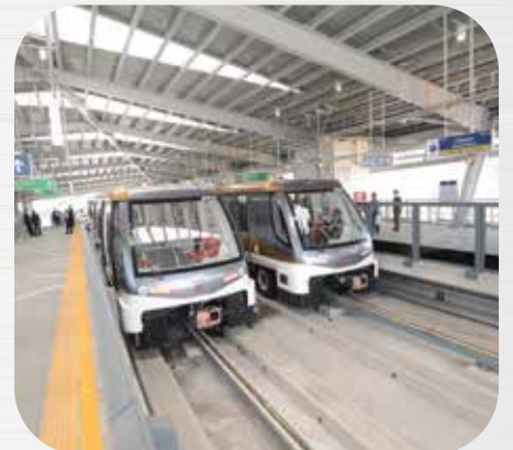
รถไฟฟ้าสายสีทอง The BTS Gold Line Project